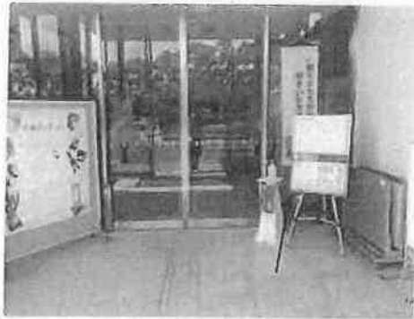
来館者への注意喚起案内板と アルコール消毒液