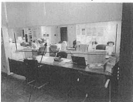
透明ビニールカーテンを設置