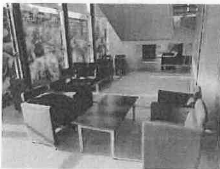
休憩スペースの座席数を減らす