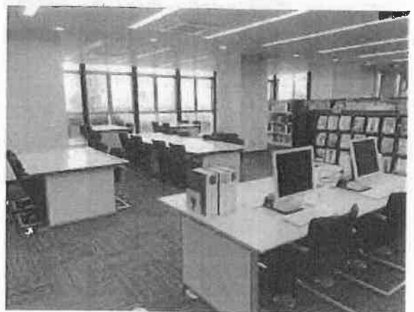
閲覧席の座席数を減らす