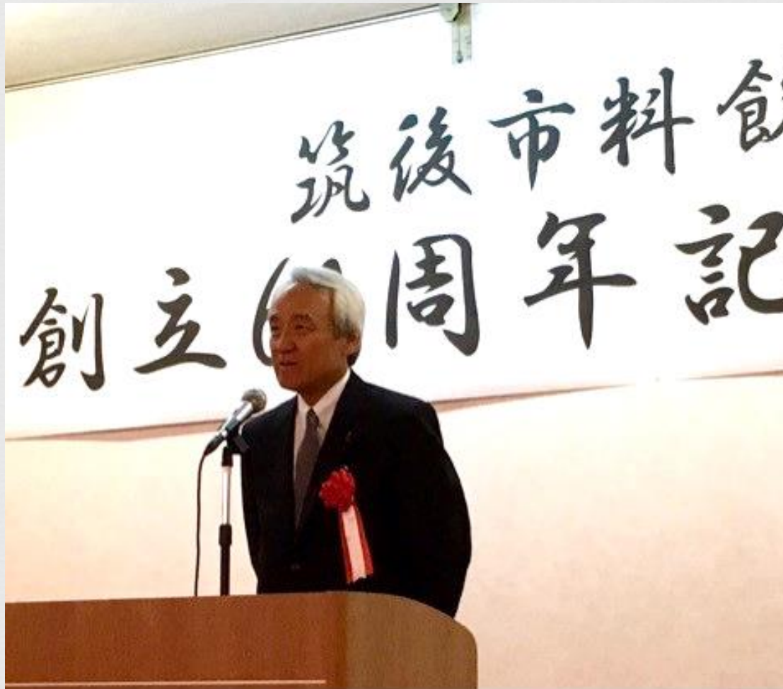
藏内勇夫 福岡県議会議員 来賓挨拶